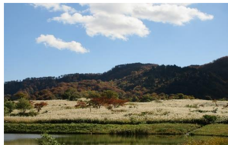
菖蒲高原のススキ